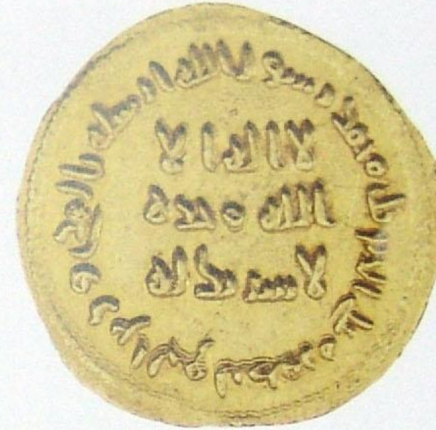
دينار أموي عبد الملك بن مروان Umayyads Dinar Abdel Malik Bin Marwan